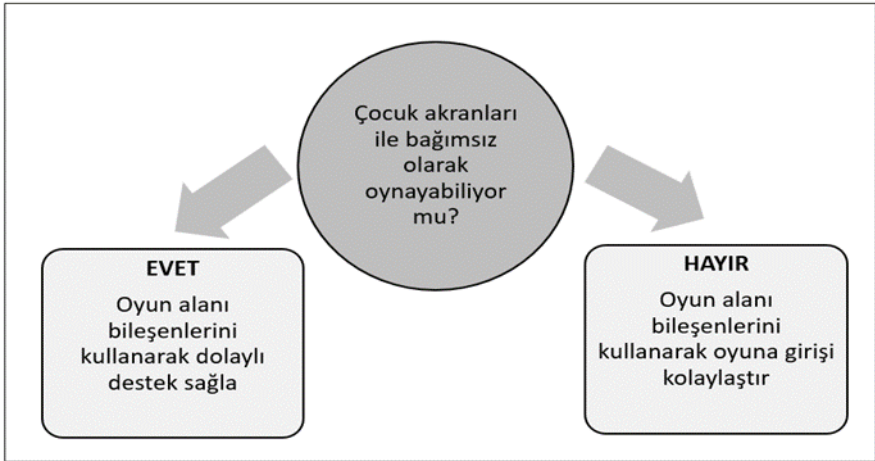
Şekil 1. Çocuğun Oyun Sürecinde Öğretmen Yaklaşımı

devam etmesini, geliştirilmesini, akranlar arasındaki etkileşimlerin zenginleştirilmesini ve oyunların sembolik boyutunun güçlendirilmesini amaçlar. Bu amaca dolaylı şekilde ulaşmak için öğretmen, açık oyun alanı bileşenlerine, oyun alanının tasarımına, oyun alanının verimli kullanımına ve oyun niteliğinin artırılmasına yönelik ipuçlarını önceden planlar. Bu ipuçları, temalar ve oyun materyalleri ile çocukların somut bir şekilde deneyimleyeceği şekilde açık oyun alanında bulunur. Tüm bu ön planlamalara ek olarak, öğretmen çocuklara rehberlik eder. Ancak bazı zaman ya da durumlarda dolaylı müdahale stratejileri yeterli olmaz. Çünkü küçük çocuklar gelişim özellikleri nedeni ile bilişsel olarak işlem öncesi ve egosantrik bir düşünce evresindedirler (Paiget, 1964). Bu nedenle çocuklar kendi davranışlarını düzenlemeleri için yeterli muhakeme, dil ve sosyal becerilere henüz sahip değildir. Öğretmenin oyun alanındaki gözlemleri, onun oyuna doğrudan müdahalesini gerektirecek tedbirleri almasını gerektirebilir.