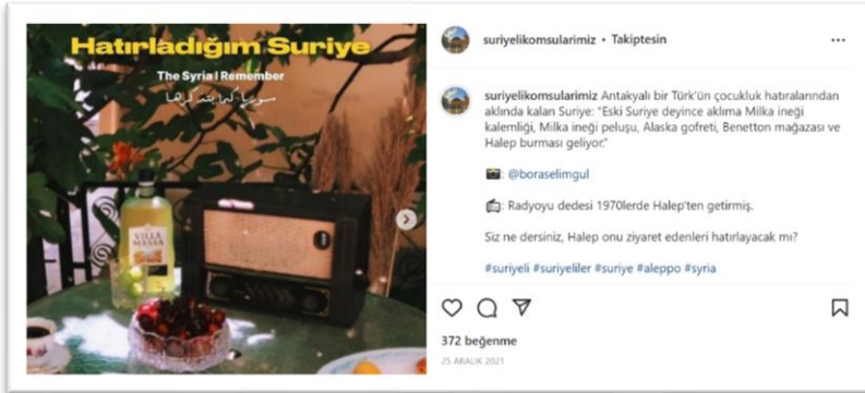
Şekil 8. Geçmişin hatırlanması ve o günlere özlem içeren paylaşım-2

Geleneksel eşyalar, hatıralar hatırlamanın geride kalan ile bağ kurmanın aracıdır. Bu bazen bir fotoğrafta, bazen bir eşyada karşımıza çıkar. Geçmişten bir nesne ile bağ kurma Connerton'un (2014) da vurguladığı gibi unutmama ve tüketme üzerine kurulu bir sisteme direnmenin ve kendini hatırlamanın da bir yoludur.