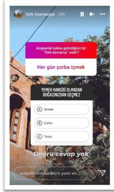
Şekil 10. Türk kültürüne dair paylaşım-2