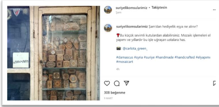
Şekil 7. Geçmişin hatırlanması ve o günlere özlem içeren paylaşım-1

Hendrich (2020) yemeğin ve içeceğin hem bireysel hem toplumsal hatıralara işaret edebileceğini, hem de bireysel hatırlamanın uyarıcısı ve nesnesi olabilir derken başlı başına hatırlamada yemeklerin önemine vurgu yapar.