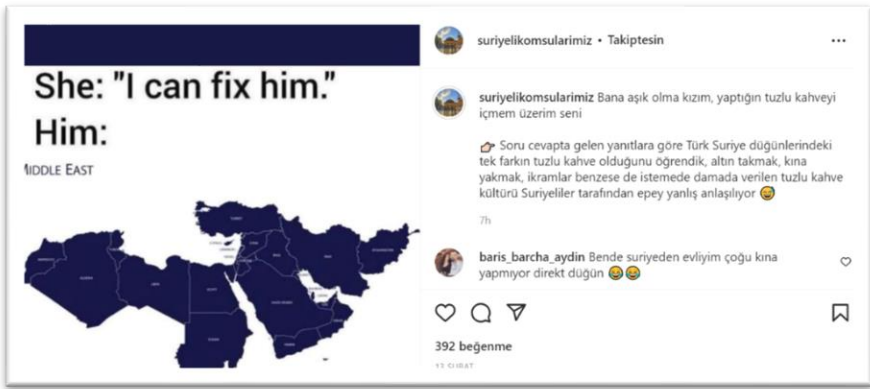
Şekil 3. Türkiye ve Suriye düđünlerine ilişkin paylaşım

toplumdaki ahlaki deęerleri ortaya ıkarmaktadır. “Bařkası” ve “ben” toplumun ayna da olan bir yansımasına benzetilmektedir. Levinas da kuvvetli olan bir olma, bütünü paraları olma duygusu “Suriyeli Komřularımız” Instagram hesabında paylaşılan gönderilerde görülebilmektedir. Aynı olmak kategorisi altında incelediđimiz içerikler, Türk ve Suriye kültürünün aslında birbirlerinden etkilendiđini göstermeye, aralarında ortak bir paylaşımın olmasına yöneliktir. Paylaşımların içerikleri genel olarak komřu olan bu iki ülkenin dini bayramları, gelenek-görenekleri, beslenme şekilleri, benzer tarım kültürlerinden oluşmaktadır.